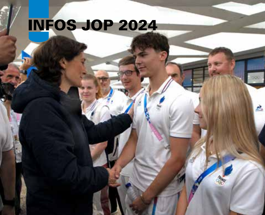
On ne peut que se féliciter de la présence de la Ministre des sports lors d'une épreuve malheureusement trop peu médiatisée.

de la fédération. En revanche les marques de toutes les armes étaient recouvertes d'un pudique scotch noir. « Autant masquer l'étoile d'une Mercedes » dira l'une des instructrices. Il est vrai qu'il n'était pas difficile de reconnaître l'identité allemande de ces armes.