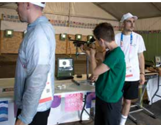
La FFTir avait installé un stand d'initiation. Très fréquenté!

Cette structure a servi également de base arrière pour l'entraînement des équipes de France avant les JO de Paris 2024 et, d'une manière plus générale, pour l'entraînement hivernal de nos champions de tir à 10, 25 et 50 mètres. Le CNTS accueillera d'ailleurs en 2025 les championnats du monde de tir. ● TP