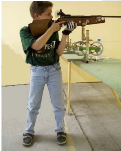
POSITION DU TIREUR CARABINE AVEC BLOC RESSORT