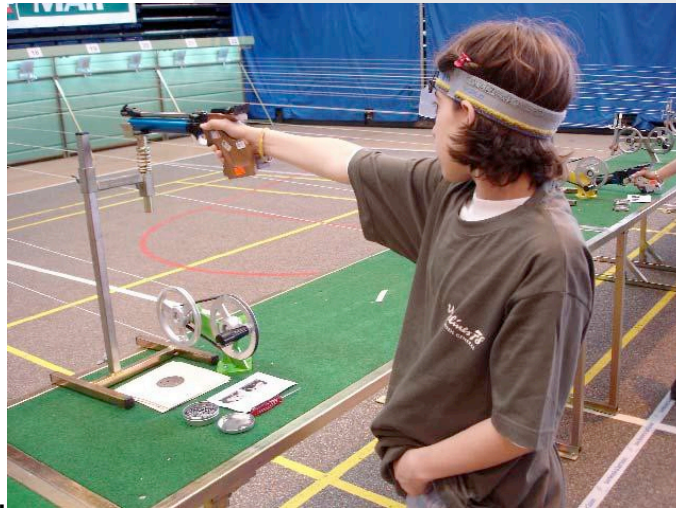
POSITION DU TIREUR PISTOLET AVEC BLOC RESSORT